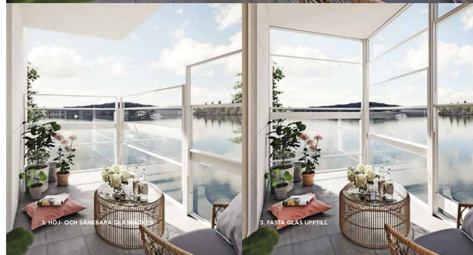
2. HÖJ- OCH SÄNKBARA GLASRÄCKEN