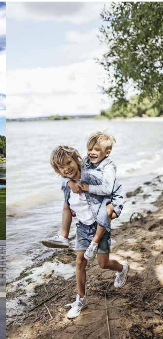
CIT I LÄ KLASSISK I VIT KULÖR