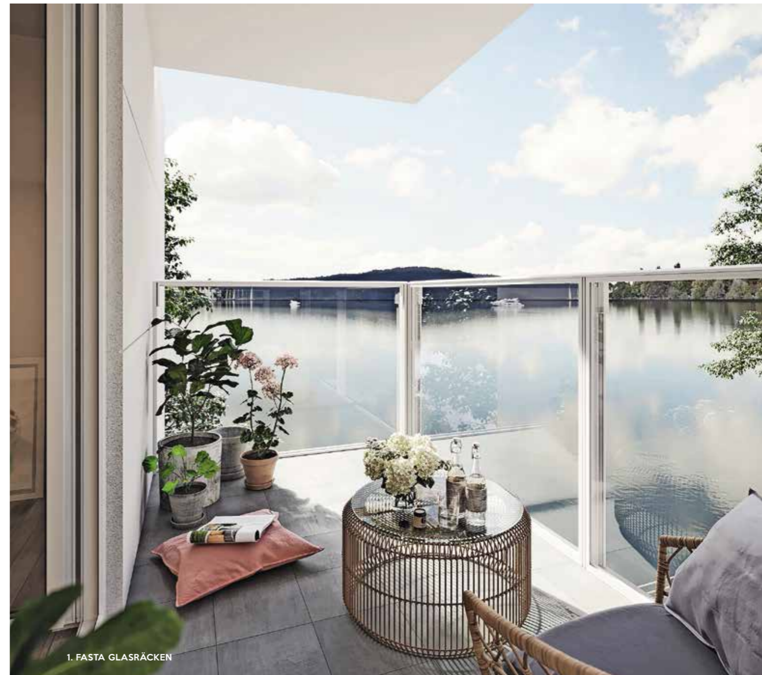
1. FASTA GLASRÄCKEN

Ett fast glas upptill, ett överljus tätar till utrymmet upp till tak eller markis och ger ett fullt vindskydd.